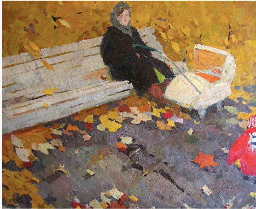
Νικολάι Ματβέεβιτς Ποζντέεφ, Autumn Day, 1961

-Να μην διαπραγματευτούν τις σπουδές τους. Οι σπουδές, η καλλιέργεια του πνεύματος.. προχωράς λίγο παραπέρα.. στο σχολείο υπάρχουν