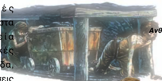
Ανθούλα Ντέτσικα Α2

καταλαβαίνουμε ότι αν ένα παιδί έχει άθλιες συνθήκες ζωής τότε το ίδιο παιδί μπορεί να καταλήξει στα χνάρια της παιδικής εργασίας που αυτό συνεπάγεται με την απώλεια της παιδικής του ηλικίας και τις παιδικές του χαρές.